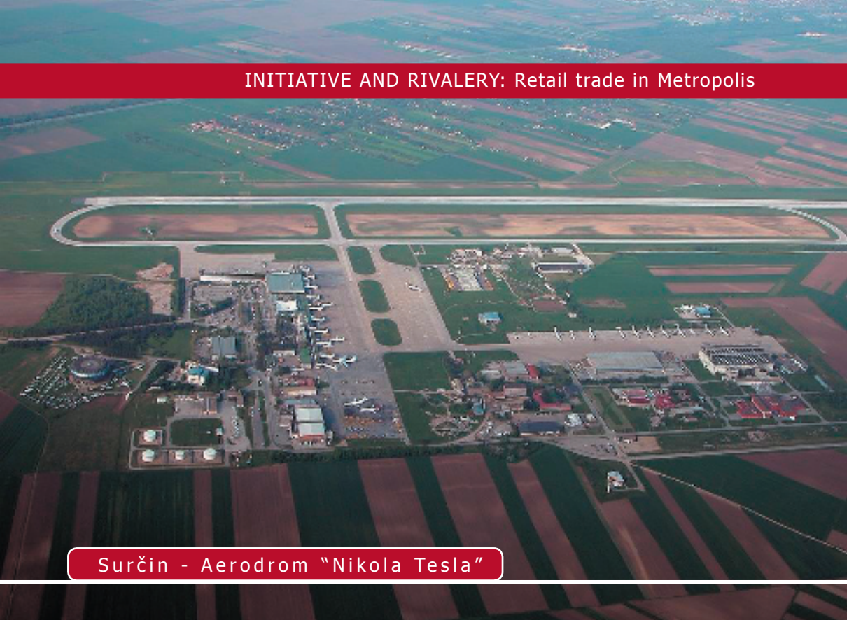
Surčin - Aerodrom "Nikola Tesla"