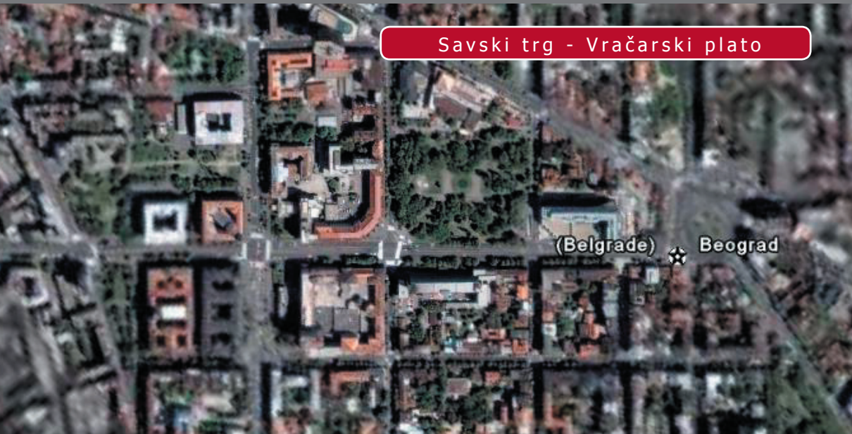
Savski trg - Vračarski plato