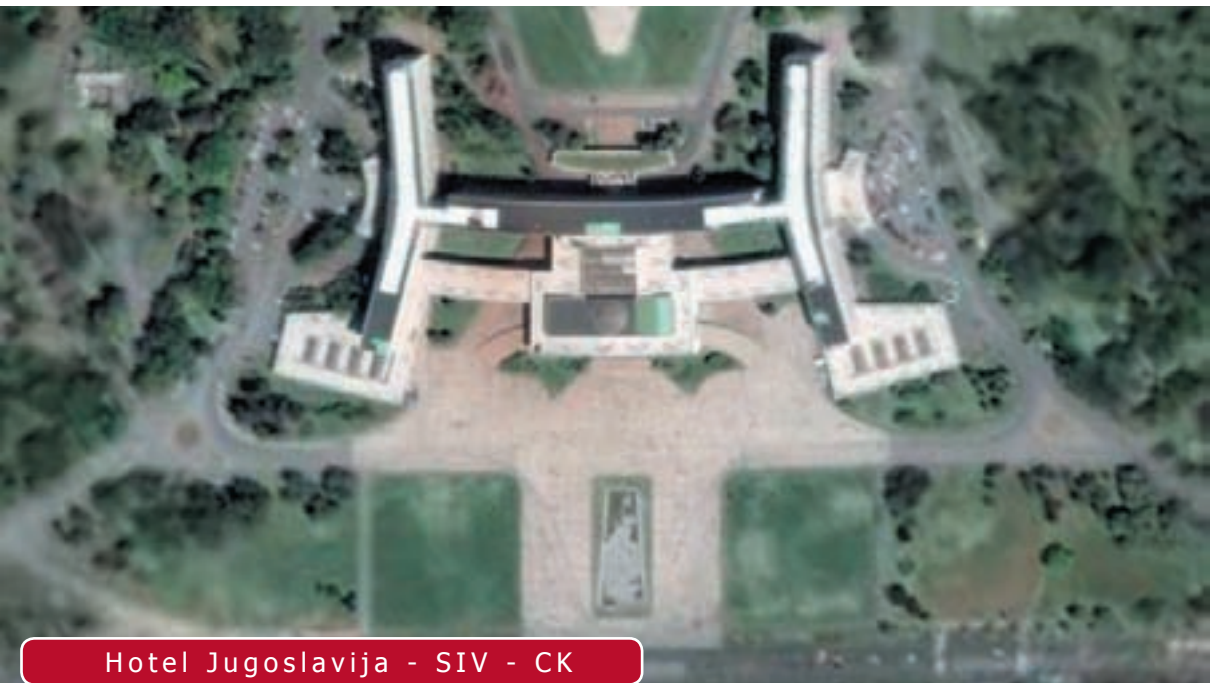
Hotel Jugoslaviya - SIV - CK